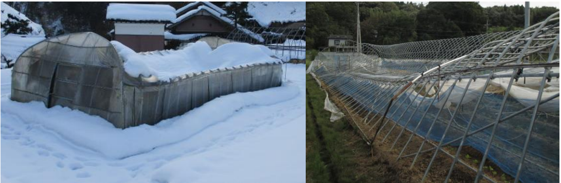
積雪・台風によるビニールハウスの被害

園芸施設とは、果樹、野菜、花き等の農作物を栽培するためのガラスハウス・ビニールハウスの本体、及び換気扇や暖房機といった付帯施設のことです。