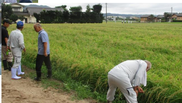
水稲の被害調査をする委員