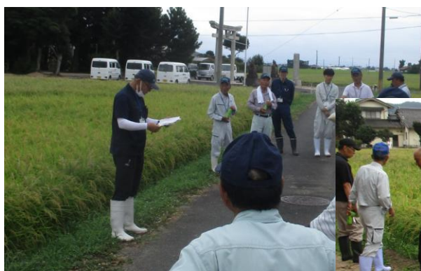
水稲の被害調査を委員に説明する職員