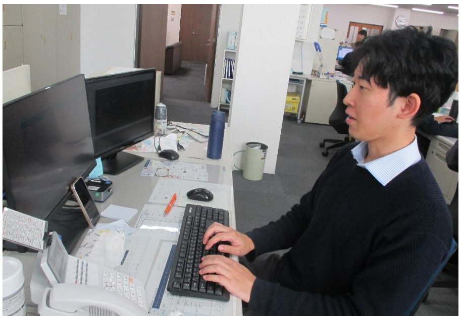
システム開発中の職員

新規採用職員の研修も担当しているため、応募者の皆様と直接関わる機会も多い部署です。